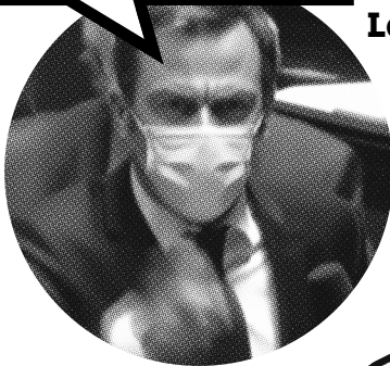
Le ministre de la Santé aux députés le 4 novembre 2020.